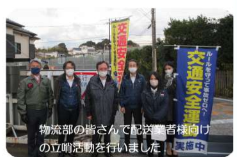
物流部の皆さんで配送業者様向けの立哨活動を行いました