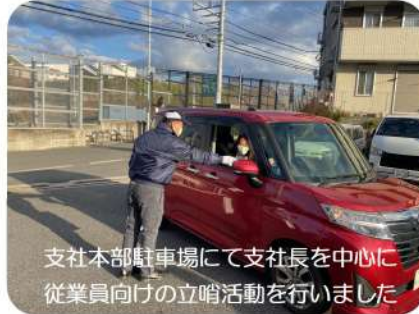
支社本部駐車場にて支社長を中心に従業員向けの立哨活動を行いました