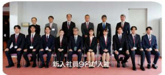
新入社員9名が入社

昇進された16名の皆さん本当におめでとうございます。皆さんのこれまでのたゆめぬ努力が認められた結果ですので、大いに誇っていただきたいと思います。同時に、上司、先輩、同僚、そして何よりご家族のサポートあってのことだと思いますので、是非感謝の気持ちを忘れていただきたいと思います。昇進は、これまでの実績があってのことはもちろんですが、会社としてはまだやったことのない立場を皆さんに託します。今までと同じものの見方では新しい立場での役割は全うできないと思います。権限を与えられるということですので、一段高い立場になり、見える景色が広がったわけですから、これまでより気を配る範囲、責任が広がります。会社全体のこと、部下の仕事・生活のことなど、これまで意識していなかったことも意識して仕事を進めていくことになります。大変なこともあると思いますが、会社は皆さんなら十分できると思って昇進を決定していますので、是非自分に自信を持って新しいステージに踏み出していただきたいと思います。昇進された皆さん改めておめでとうございます。