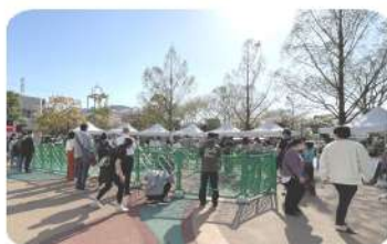
ワンちゃんのマッサージ教室