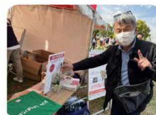
保護犬募金活動も行いました