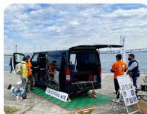
海の目の前に展示しました！