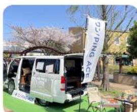
小田原ダイナシティにて展示