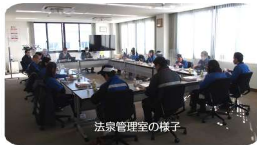
法泉管理室の様子