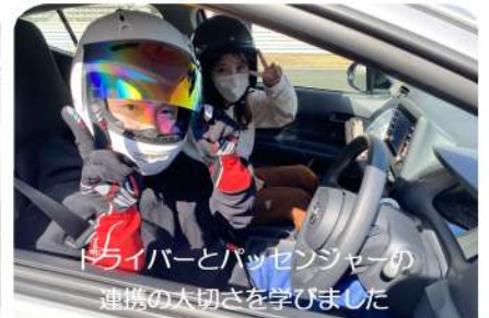
ドライバーとパッセンジャーの連携の大切さを学びました