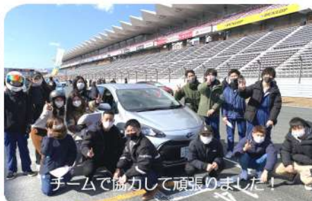
チームで協力して頑張りました！